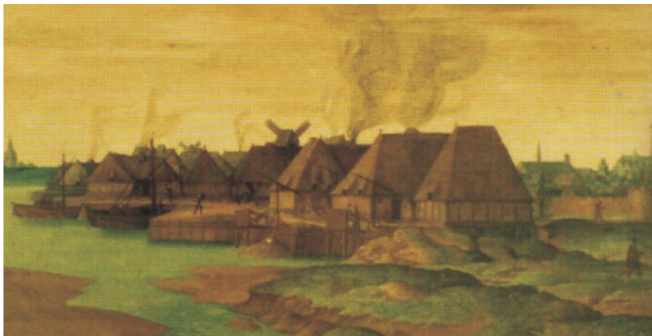
Zoutketen bij Zierikzee, 1540

In het verleden is in eigen land: Zeeland, de Noordwesthoek van Brabant en op de Zuid-Hollandse eilanden, veel zout gewonnen. Na circa 1600 werd het ruwe zout vanuit het buitenland aangevoerd (Portugal) en hier geraffineerd.